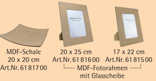
MDF-Schale 20 x 20 cm Art.Nr. 61 81700 20 x 25 cm Art.Nr. 61 81600 17 x 22 cm Art.Nr. 61 81500 — MDF-Fotorahmen mit Glasscheibe —