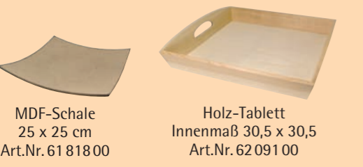
MDF-Schale 25 x 25 cm Art.Nr. 61 81800 Holz-Tablett Innenmaß 30,5 x 30,5 Art.Nr. 62 09100