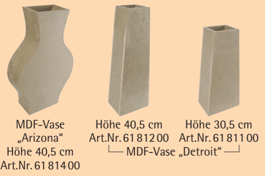
MDF-Vase „Arizona“ Höhe 40,5 cm Art.Nr. 61 81400 Höhe 40,5 cm Art.Nr. 61 81200 Höhe 30,5 cm Art.Nr. 61 81100 — MDF-Vase „Detroit“ —