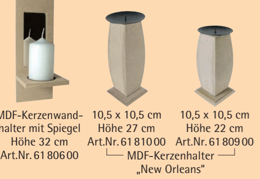
MDF-Kerzenwandhalter mit Spiegel Höhe 32 cm Art.Nr. 61 80600 10,5 x 10,5 cm Höhe 27 cm Art.Nr. 61 81000 10,5 x 10,5 cm Höhe 22 cm Art.Nr. 61 80900 — MDF-Kerzenhalter „New Orleans“ —