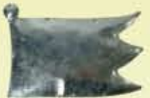
Weißblech-Flagge, 15,5 x 10,5 cm Art.Nr. 25 061 00