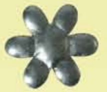
Weißblech-Blume, 14 cm Ø Art.Nr. 25 063 00