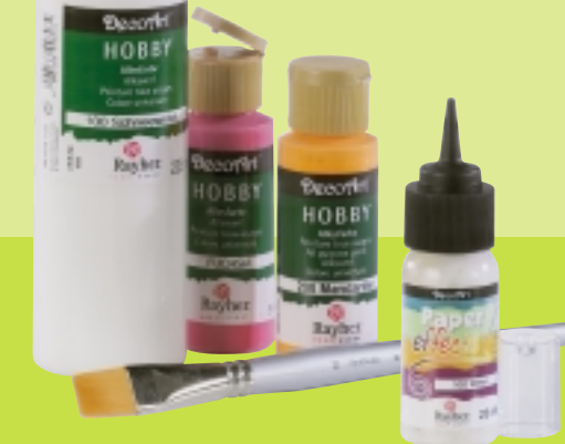
DecoArt Allesfarbe Rayher Pinsel